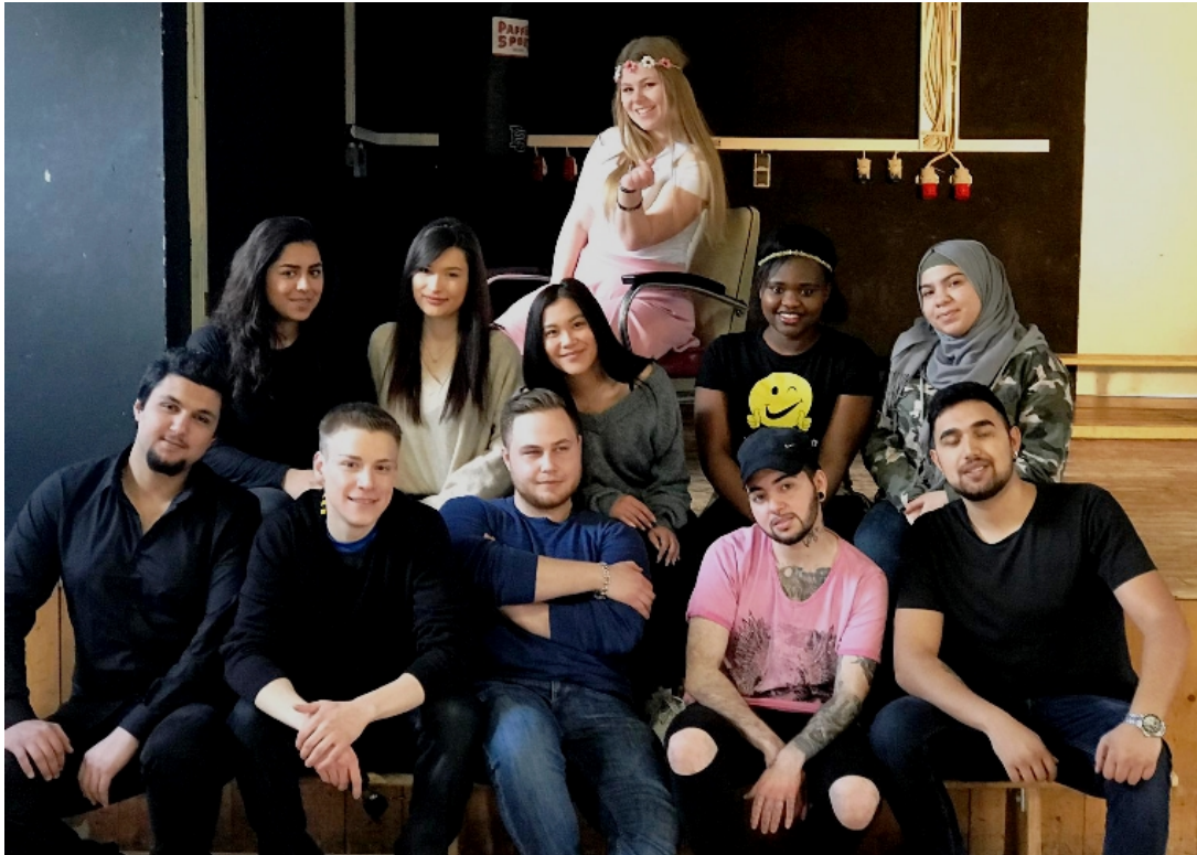
Bildunterschrift: Teilnehmende des Theaterprojekts JobAct während der Proben zu Woyzeck

Woyzeck ist ein Getriebener, ein Verzweifelter auf der Suche nach Sinn und Bedeutung. Büchners Text ist ein Szenenfragment um den armen Soldaten Woyzeck, der von den Menschen um ihn herum zugrunde gerichtet wird und schließlich mordet. Der Hauptmann weist ihn zurecht, sein Arzt experimentiert an ihm mit einer Erbsenkur, dafür bekommt er ein paar Groschen, die er zu seiner Geliebten Marie und ihrer beider Sohn trägt. Marie betrügt ihn mit dem feschen Tambourmajor. Als Woyzeck das herauskriegt, ersticht er Marie – das Liebste, was er hat.