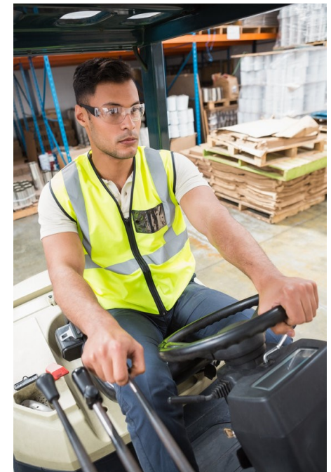
Jugendberufshilfe Düsseldorf gGmbH

Fachpraktiker/in für Kreislauf- und Abfallwirtschaft